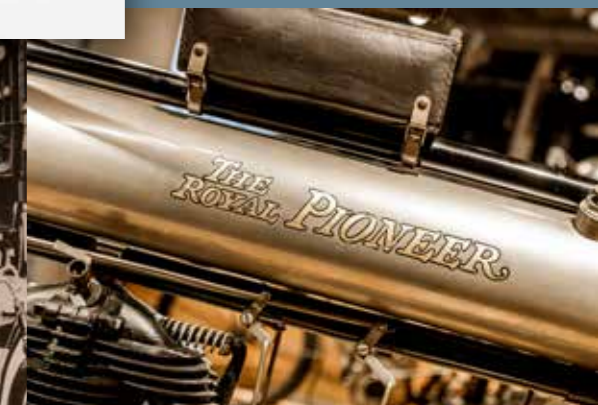
Amerikaans merk de Royal Pioneer.