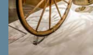
Een tweewieler op stoom uit 1867.