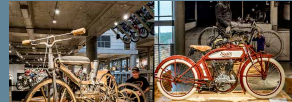
Een van de Amerikaanse merken: Sears.