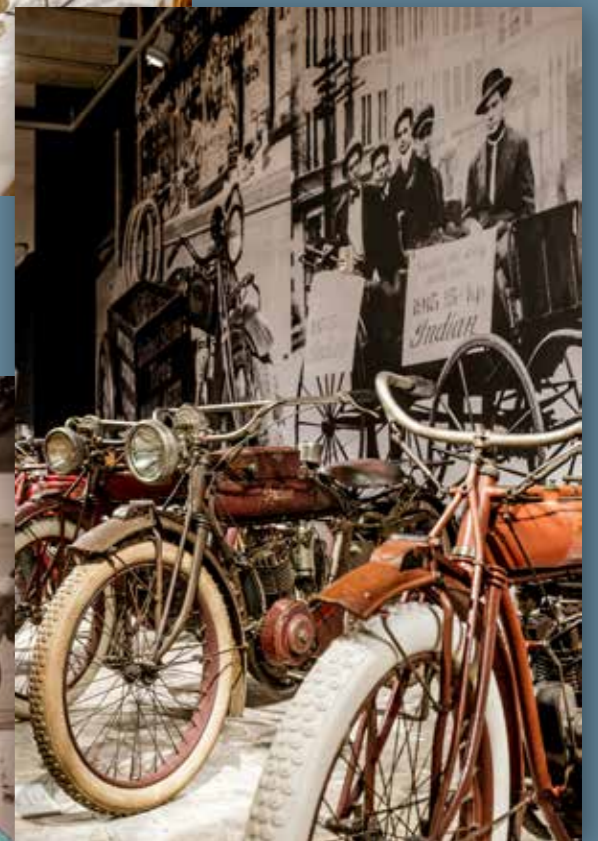
De motorfiets bracht Amerika in beweging.