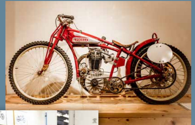
Een zeldzame Crocker Speedway uit 1935.

'Ik zag een stukje ijzer uit de zandvloer steken.'