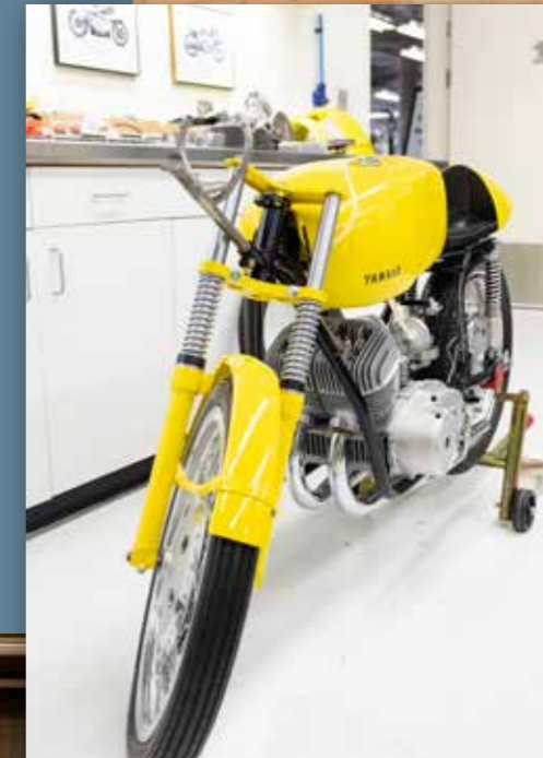
De Yamaha 'Yellow Tanker', opgehaald bij een zonderling in Ohio, wordt opgebouwd.